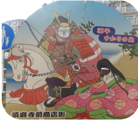
源平合戦 ゆかりの地